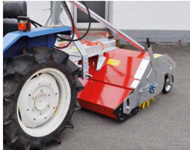
Kehrmaschine für diverse kompakte Trägerfahrzeuge geeignet.