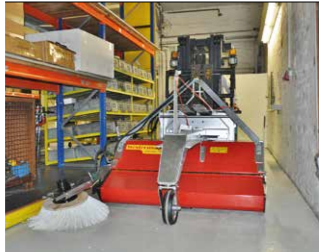
Ein zusätzlich optional erhältlicher Seitenbesen sorgt für Sauberkeit bis an die Kanten.