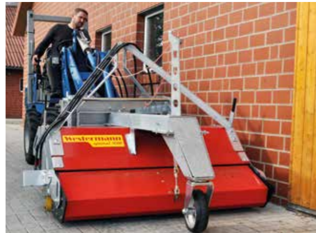
Die hohe Wendigkeit der Kehrmaschine ermöglicht ein sicheres Rangieren auch in Wandnähe.