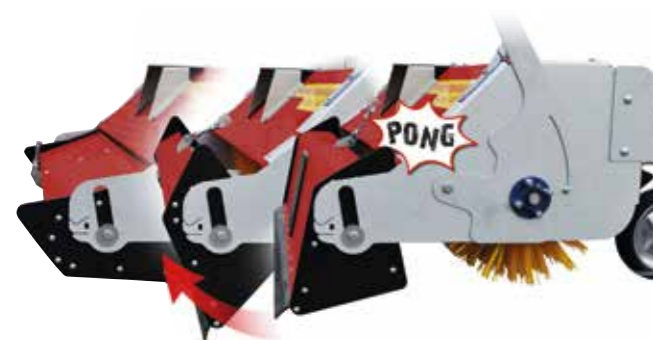
Mit einem Ausschlagwinkel von über 90° wird die serienmäßig zugehörige Sammelwanne komplett und ohne Rückstände geleert.