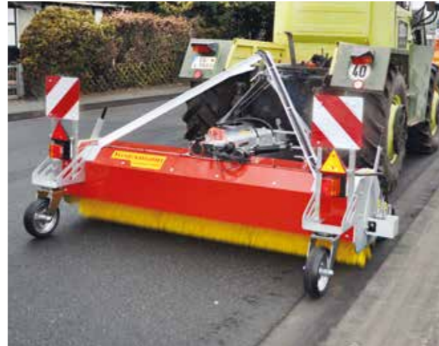
Demontage des Seitenbesens für die Flächenreinigung dank einfachem Hochstellen nicht nötig.