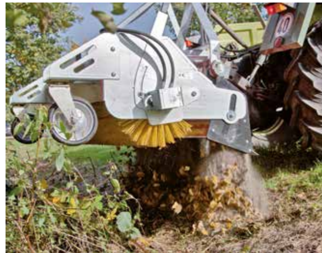
Einfache und komplette Leerung der Sammelwanne.