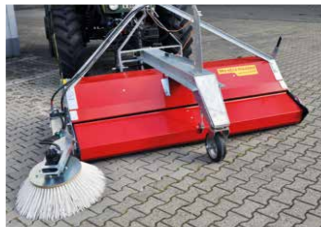
Der zusätzliche Seitenbesen sorgt für Sauberkeit bis an die Kanten.