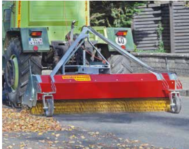
Laubmassen und andere Verschmutzungen werden schnell und sauber aufgenommen.