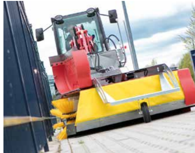
Zusätzliche Seitenbesen zum Kantenausfegen sind nicht notwendig.