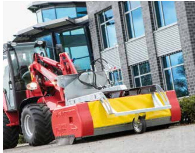
Vorhandene Trägerfahrzeuge werden zu perfekten Reinigungsmaschinen umfunktioniert.