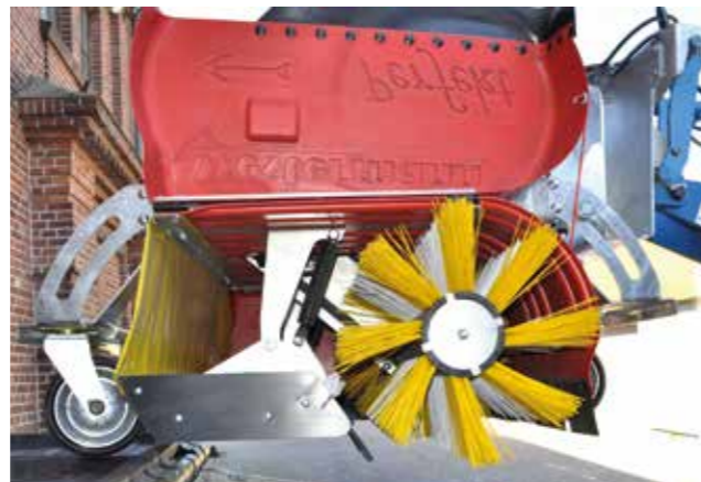
Die pendelnd aufgehängte Bürstenwalze und der integrierte Hydraulikzylinder passen sich dem Untergrund perfekt an und ermöglichen einen stetigen Bodendruck. Die Leerung der Sammelwanne ist simpel.