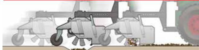
Bedingte Höhenregulierung durch starre Bürstenaufhängung verhindert das Ausfegen von unebenen Untergründen.