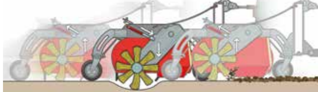
Brilliante Boden Anpassung sogar bei schweren Bedingungen sorgt für ein perfektes Ergebnis in Sicken und Löchern.